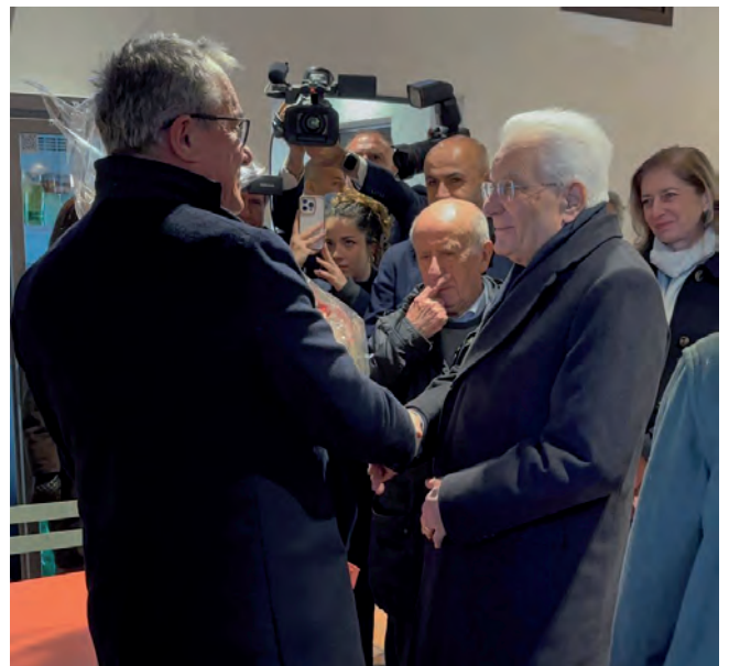
Luciano Pantarotto accoglie il Presidente Mattarella all'Open Bar della Terza Casa

Lo incontriamo all'Open bar-tavola calda di via Bartolo Longo, della Terza Casa di Rebibbia, la struttura