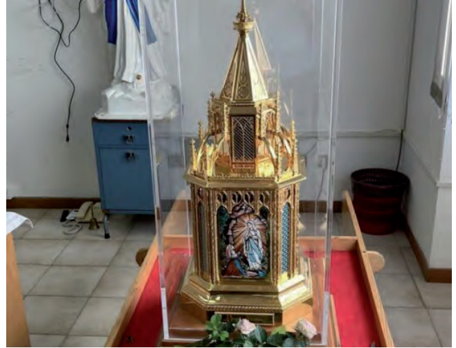
Le reliquie di santa Bernadette a Rebibbia

tita così vicina al cuore di ciascuno. Sarà difficile dimenticare questa giornata, così straordinaria e così fuori dalla routine del carcere. L'auspicio è che possa far comprendere a tutti che anche e soprattutto in realtà come il carcere c'è bisogno di spiritualità, per sostenere la vita di chi è