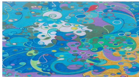
ARCHITETTO LEONARDO BORCHIA