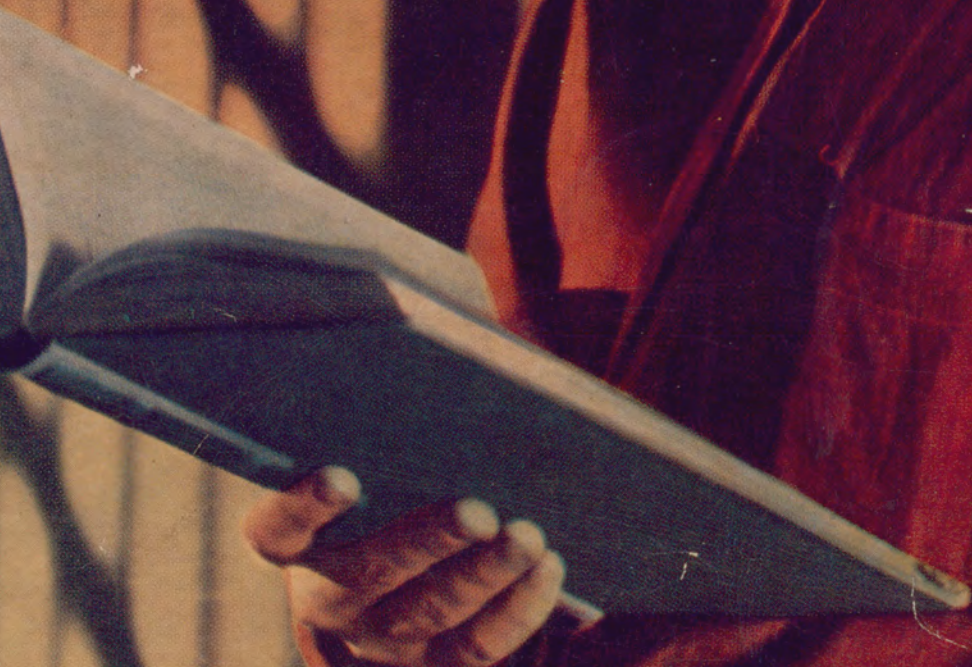
Immagine tratta dalla locandina del film "Cella 2455: braccio della morte" di Fred F. Frears (1955)

sulla vicenda di Caryl Chessman "giustiziato" nel carcere di S. Quintino in California il 2 maggio 1960 dopo 12 anni di reclusione nel braccio della morte