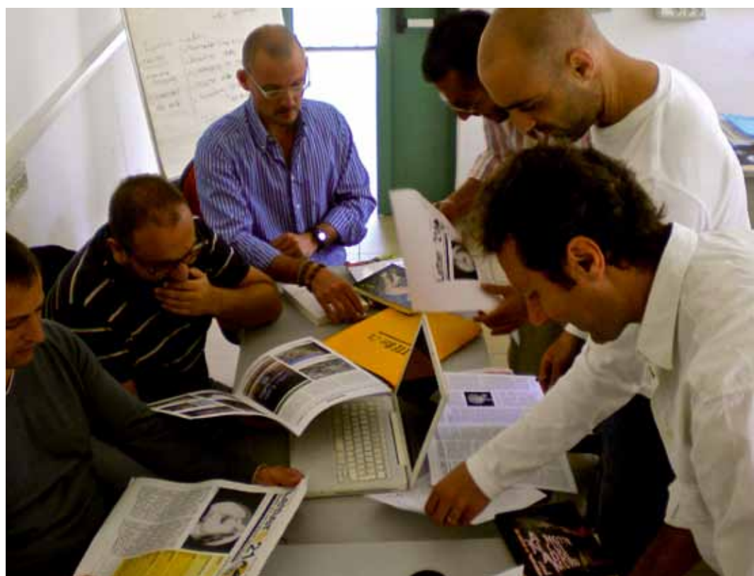
La redazione all'opera

Edizione speciale Fiera del Libro ..... In questo numero: