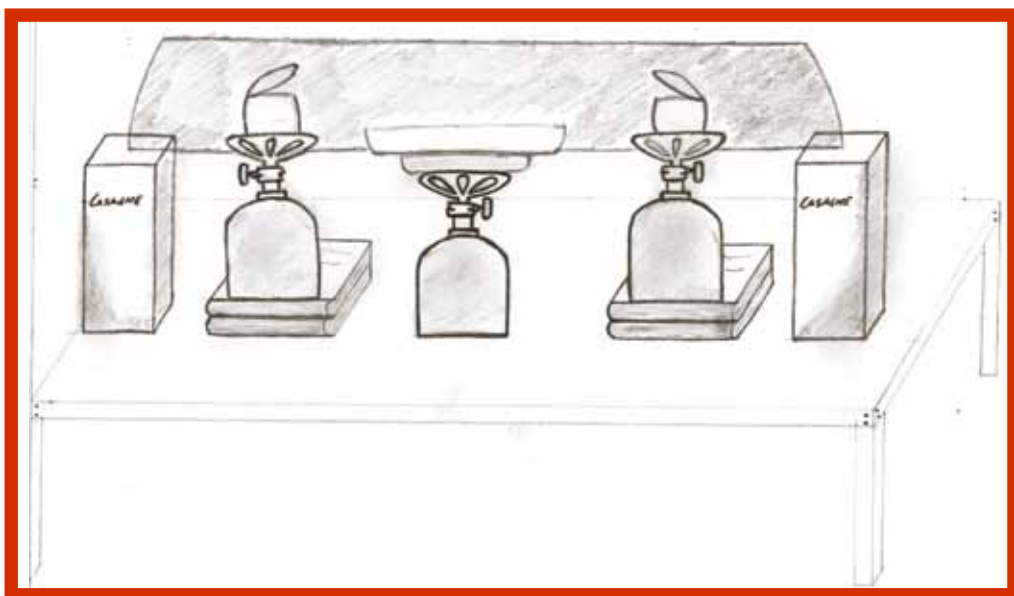
"forno da campeggio"