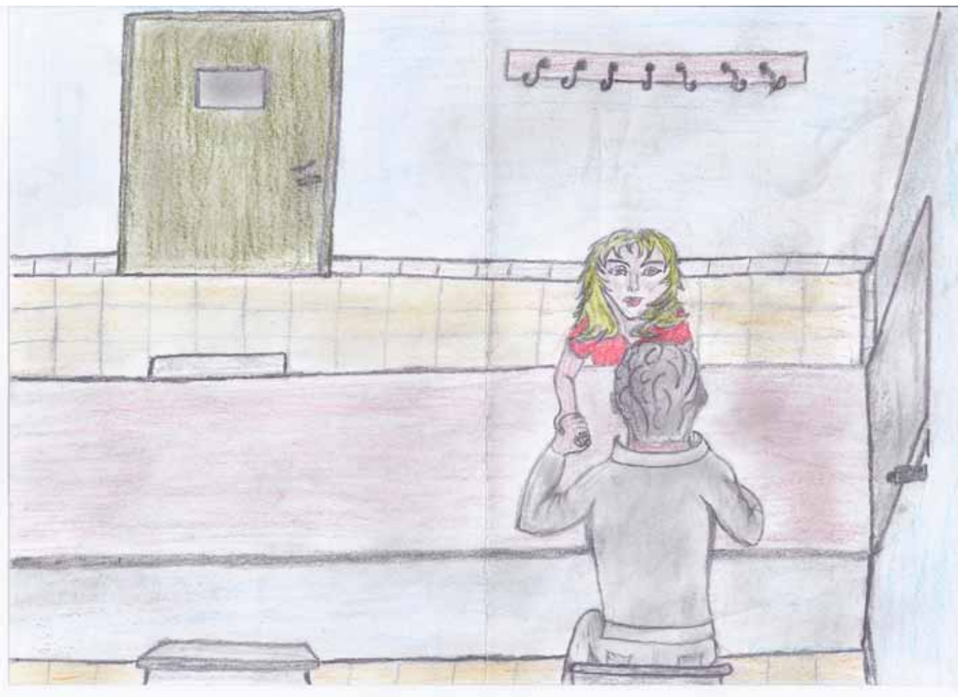
Disegno di Robert L. ▲