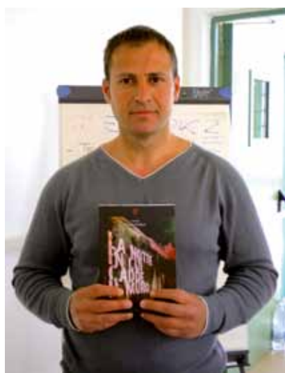
Renatus Deckert (a cura di), La notte in cui cadde il muro , Scritturapura

La notte in cui cadde il muro è il libro simbolo della caduta del sistema comunista in tutta Europa e il sogno di uscire da un regime dittatoriale per poter esprimere liberamente le proprie idee e muoversi senza barriere anche solo per incontrare i propri parenti dall'altra parte del muro. In questa raccolta ci sono le testimonianze letterarie dedicate al novembre 1989 di autori che hanno vissuto in prima persona l'autunno della svolta, di autori che hanno raccontato per immagini le memorie e le emozioni custodite nella loro testa. La caduta del muro ha illuminato "l'ultima vendetta" di coloro che cercavano disperatamente di mantenere un potere ormai svanito. La notte di Berlino sarà ricordata come un evento storico che rappresenta la scomparsa della DDR. Con la caduta del muro scompare una delle maggiori contraddizioni del Novecento, cioè un monumento all'assurdo. La politica comunista aveva alle spalle il muro, quel muro che lei stessa aveva costruito. Questo libro è la bandiera della rivoluzione che attraverso 25 racconti dedicati alla notte del 9 novembre permetterà di capire meglio l'ipocrisia delle divisioni.