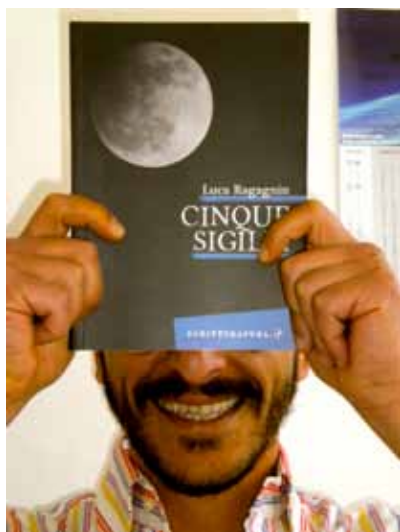
Luca Ragagnin, Cinque Sigilli , Scritturapura

L'universo femminile, si sa, è complicato e misterioso. Ragagnin nei cinque racconti del Cinque Sigilli cerca di penetrarlo e farci comprendere il perché di certe vite concluse tragicamente.