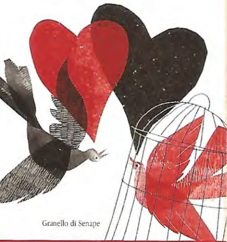
Granello di Senape

Raccolta disordinata di buone ragioni per aprire il carcere agli affetti