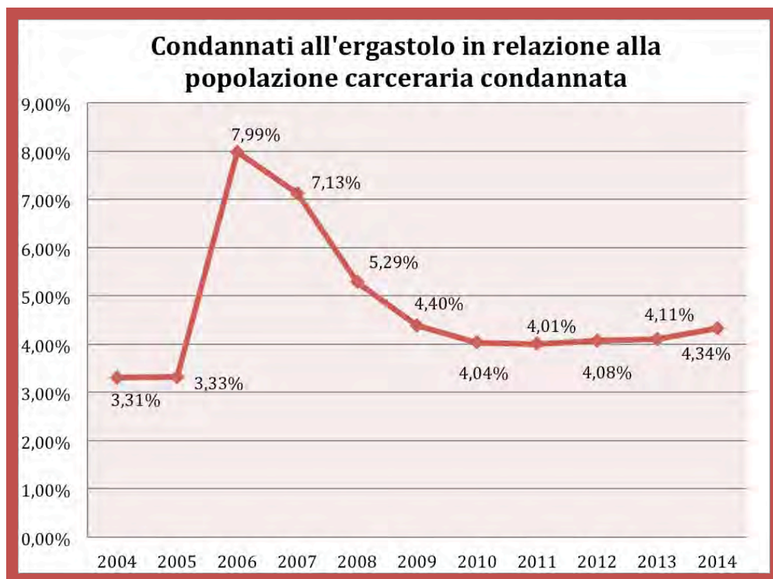
Tab. 1: Condannati all'ergastolo (con almeno una condanna definitiva) in relazione all'intera popolazione carceraria condannata – dati in percentuale (aggiornati al 30 giugno 2014).

Il primo grafico (tab. 1) indica l'andamento in percentuale dei condannati all'ergastolo rispetto ai detenuti condannati, nell'arco temporale di dieci anni.