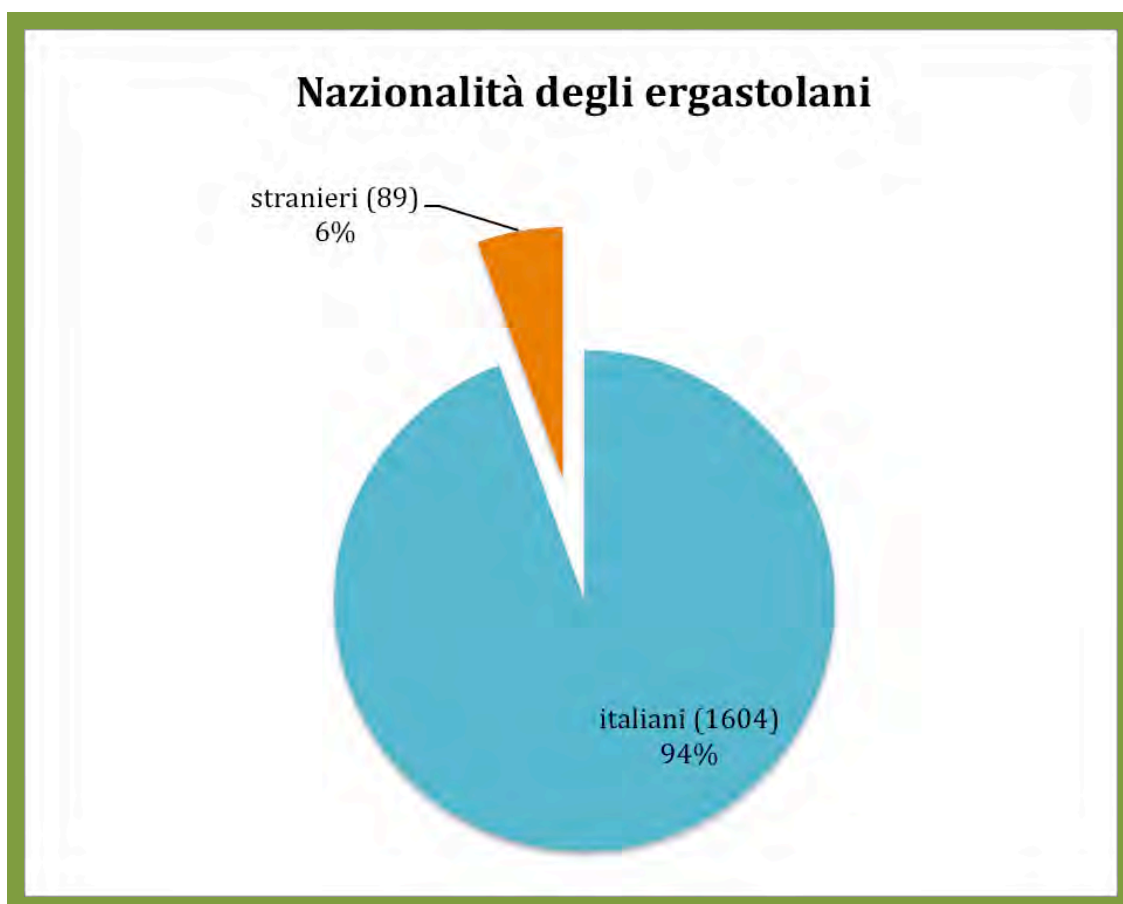
Tab. 4: Detenuti condannati all'ergastolo in base alla nazionalità (dati aggiornati al 30 giugno 2014).

ergastolani stranieri rappresentano solo l'1% della popolazione carceraria straniera, per lo più condannata per reati di minore gravità.