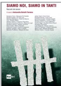
Il libro che raccoglie i racconti finalisti

Man mano i finalisti presenti salirono tutti sul palco e purtroppo mancavano diverse persone, sia tra i tutor che tra i detenuti. Dopo la presentazione della giuria, Pino Insegno ha chiamato sul palco i tre vincitori, iniziando, come si fa in