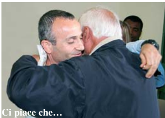
Ci piace che...