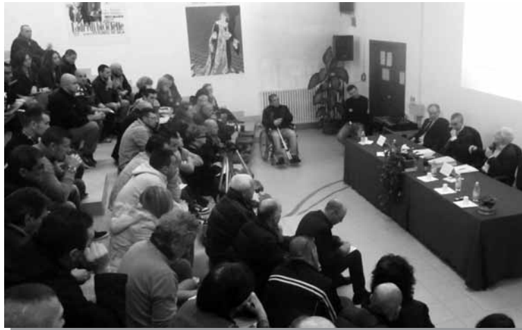
Un momento dell'incontro sull'ergastolo nel carcere di Padova, organizzato da "Ristretti Orizzonti"

Quando un magistrato di sorveglianza dice: "Sì, questa persona mi sembra che meriti di uscire in permesso premio o in semilibertà" ha la garanzia che quell'uomo non farà più niente di male? No. Capita, può capitare. E allora si dice che non ha senso parlare di rieducazione