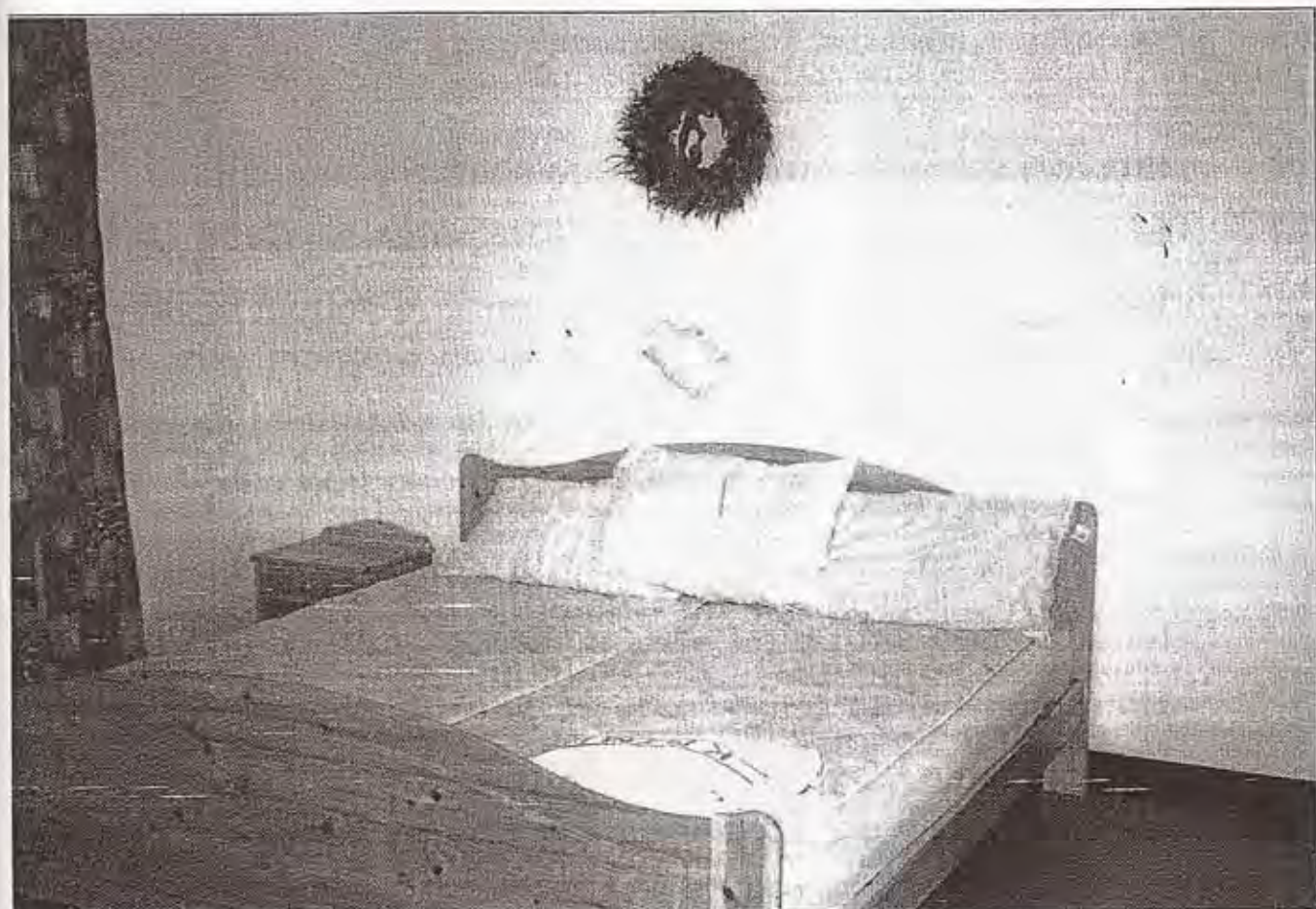
Cella dell'amore in Svezia fornita di servizi