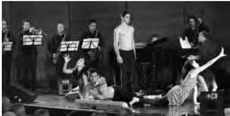
Due immagini dello spettacolo che ha coinvolto detenuti e artisti esterni alla casa circondariale

Dal carcere al palcoscenico dell'Auditorium Bpl