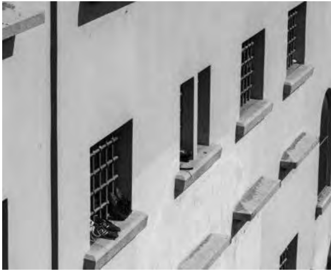
Per i reclusi l'opportunità di un colloquio con i familiari rappresenta la forma privilegiata di contatto con il mondo esterno