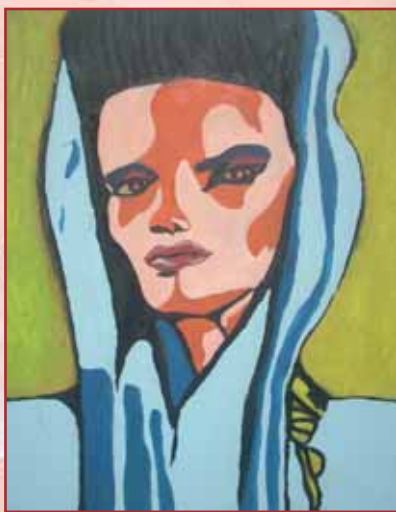
"Volto" tavola cm. 30x40