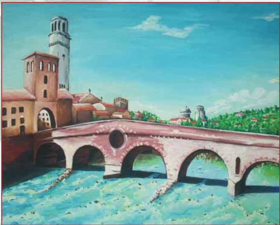
"Ponte Pietra" olio su tela cm. 60x50