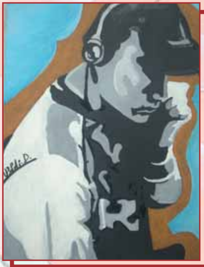
"Deejay" tavola cm. 30x50

Vorrei fare una riflessione su un pensiero di S. Francesco d'Assisi: "L'uomo è destinato al bene ma incline al male" e lui ha saputo scoprire, accogliere ed assumere i lati negativi della sua persona, della sua fraternità, della società e della chiesa al fine di poterli trasformare e renderli positivi. Noi volontari ci spendiamo per stimolare la voglia di provare, di tentare un'altra strada, di riuscire a dare alla propria vita uno slancio e una prospettiva molto più ampia, più grandiosa, più degna di ciò che ciascuno porta nel cuore e che così raramente viene preso sul serio. L'arte è un'ottimo strumento per risvegliare, per scuotere, per richiamare a più alte mete aprendo l'animo a sentimenti ed emozioni profonde, a quella dignità divina che è propria di ciascuna persona. Per noi è importante saper cogliere e mostrare ciò che di bene, di buono e di grande è in ciascuno aiutando a superare la mediocrità, l'adagiarsi nel comune squallore con la scusa che non è poi così gran male.