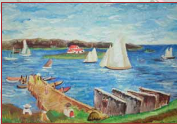
"Primavera" tavola cm. 40x30

Riflessioni in cerchio (corso intercultura)