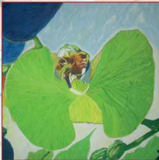
"Orchidea" olio su tela cm. 52x52