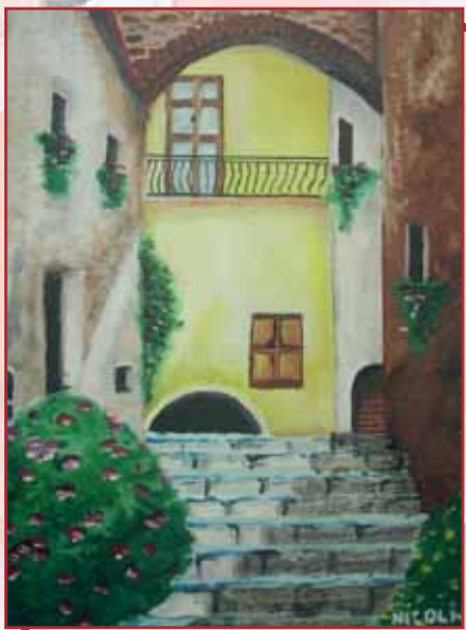
"Angolo antico" olio su tela cm. 30x40