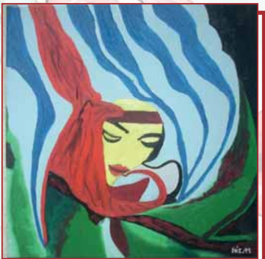
"Fiore di donna" olio su tela cm. 52x52