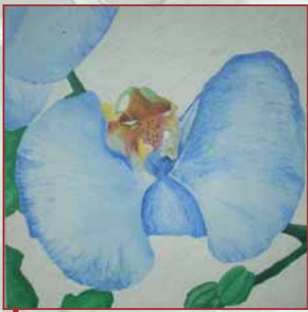
"Orchidea" olio su tela cm. 52x52

Nel carcere di Montorio oggi e' difficile il raggiungimento dell'obbiettivo; sovraffollamento, scarsità di personale della Polizia Penitenziaria, educatori che non riescono a raggiungere tutti i detenuti.