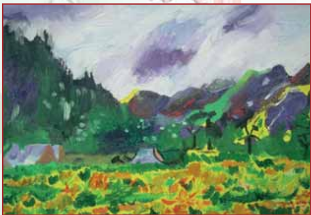
"Paesaggio" olio su tela cm. 40x30