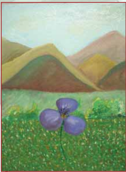
"Amore mio" tavola cm. 30x40

Di gesti felici e positivi in questo ambiente dove mi trovo oggi ce ne sono pochissimi. Uno di questi è quello che fanno i volontari. Ogni tanto qualche gesto di solidarietà tra di noi, donandoci un consiglio, un po' di sostegno con qualche parola positiva; e a volte solo il gesto di sentire lo sfogo o i problemi di un compagno, è un bel gesto.