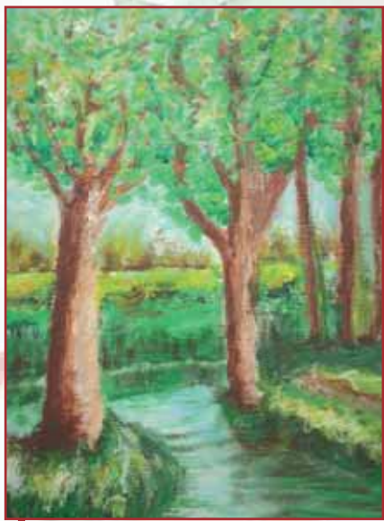
"Torrente" olio su tela cm. 30x40