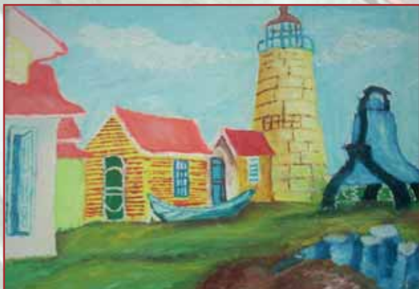
"Il faro" olio su tela cm. 40x30