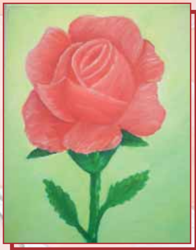
"Rosa" olio su tela cm. 25x30

Il 2011 vede anche una serie di cambiamenti importanti nel rapporto tra le associazioni e le Istituzioni perché seppur con difficoltà, si stanno cercando dei punti di incontro per poter raggiungere l'obiettivo di Rieducare e Riabilitare: è solo con questo obiettivo ben chiaro nelle nostre menti che potremmo avere successo con i detenuti, certamente non con tutti, ma con tanti si !! Dovrebbe essere chiaro a tutti che se all'interno del carcere si riesce a far prendere coscienza ai detenuti della loro vita passata e si riesce a far elaborare loro un progetto di vita nuova e diversa, dopo..avremmo cittadini migliori e città più sicuri.