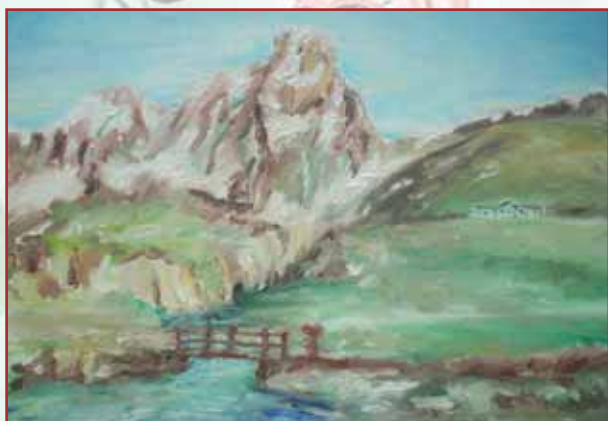
"Paesaggio Montano" olio su tela cm. 40x30