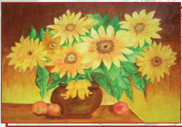
"Fiori gialli" olio su tela cm. 40x30