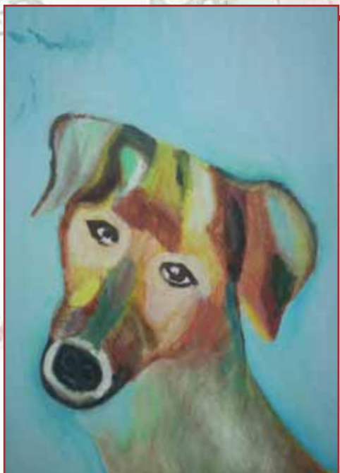
"Cucciolo" tavola cm. 30x40

Quanti di noi avrebbero bisogno di una guida e quanti di noi potrebbero sinceramente dire di non desiderarla? Forse basterebbe per un attimo guardarsi dentro e così scoprire che per entrare nella luce basta un sorriso.