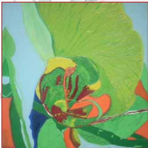
"Orchidea arancio" olio su tela cm. 52x52