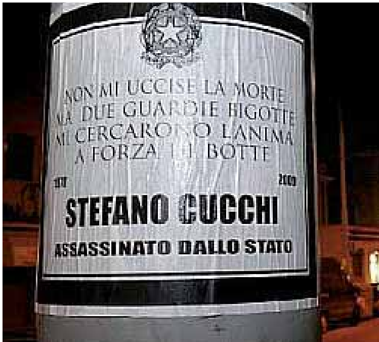
Un manifesto apparso sui muri di Roma. Il testo è tratto dalla canzone "Un Blasfemo" di Fabrizio De Andrè