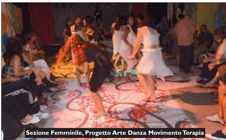
Sezione Femminile, Progetto Arte Danza Movimento Terapia

Pochi giorni fa l'Istat ha reso noto che due milioni e mezzo di italiani vivono in condizioni di "povertà assoluta", non hanno cioè le risorse sufficienti per acquisire quel minimo di beni e servizi (alimenti, abitazione, sanità, istruzione) considerato indispensabile per una qualità della vita - appunto - "minima". Insomma, non hanno il minimo indispensabile per soddisfare i bisogni essenziali. Non si tratta dei "barboni" o dei c.d. "senza dimora" o degli immigrati irregolari - che ovviamente non entrano nel conteggio perché non risultano neppure all'anagrafe - ma di normali cittadini, di gente comune, che vivono al di sot-