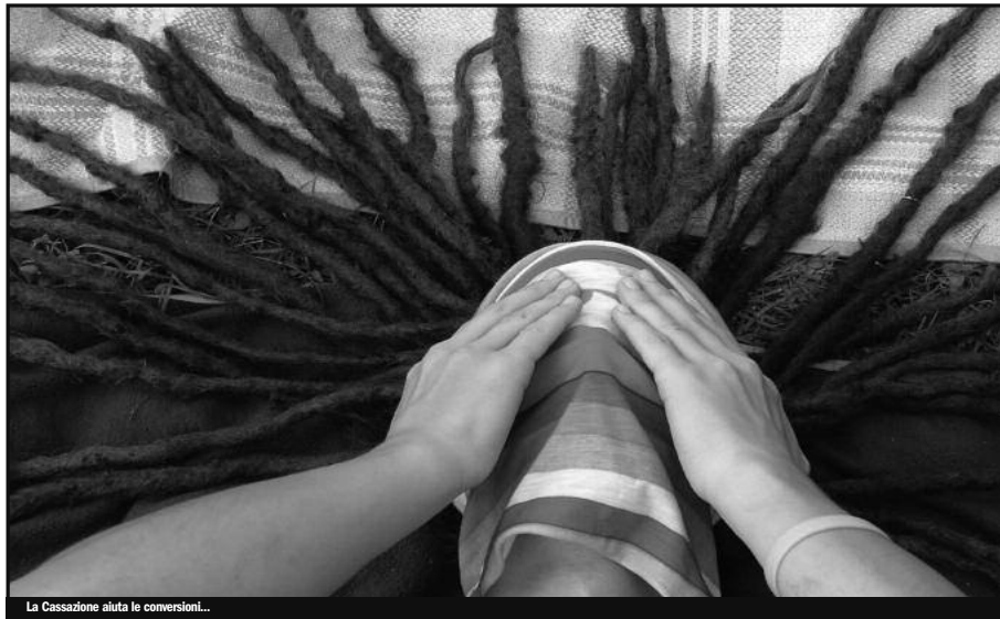
La Cassazione aiuta le conversioni...

Un nuovo inverno ci attende, sperando che dal territorio e dal contesto internazionale possano venire prassi e sperimentazioni che incrinino la gabbia d'acciaio in cui ci vogliono rinchiusi i guerrieri della droga.