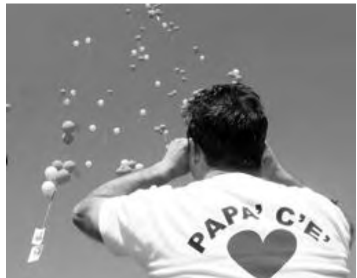
Essere genitori significa saper stare sempre vicini ai propri figli a costo di sacrifici

PER UN FIGLIO È GIUSTO RINUNCIARE A CERTE ABITUDINI