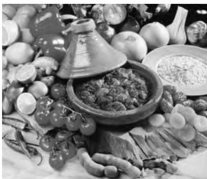
Il tagin è un recipiente di terracotta nel quale si cucina il cibo con la sua stessa umidità