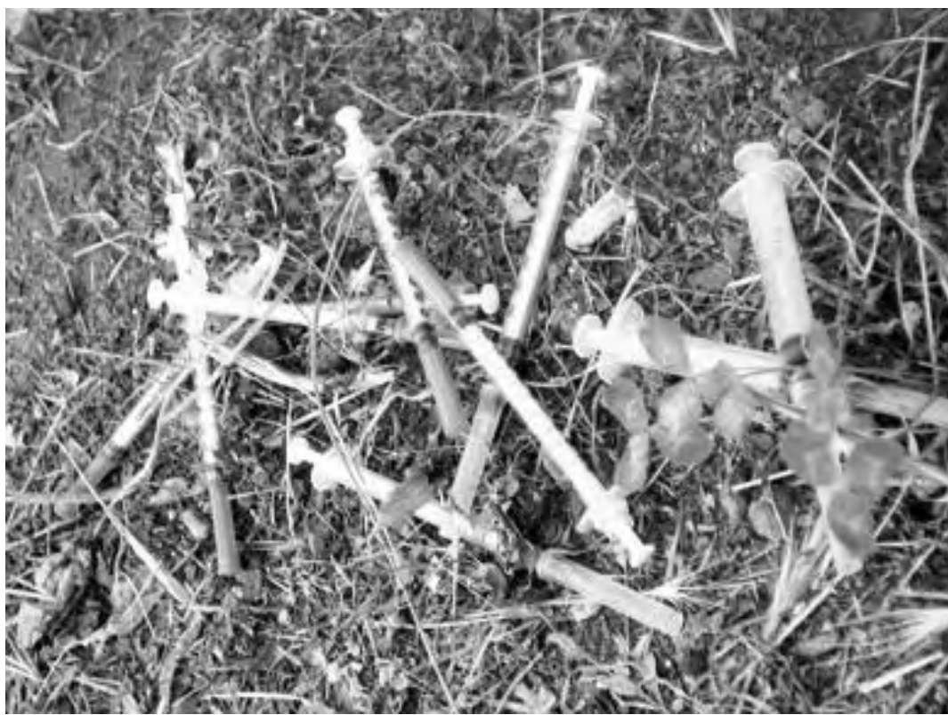
Siringhe abbandonate in un parco: la tossicodipendenza ha spesso come conseguenza l'adesione a modelli di vita randaglia

DAL CARCERE UN APPELLO AI GIOVANI CHE NON ASCOLTANO CONSIGLI E CADONO IN PERICOLOSE TENTAZIONI