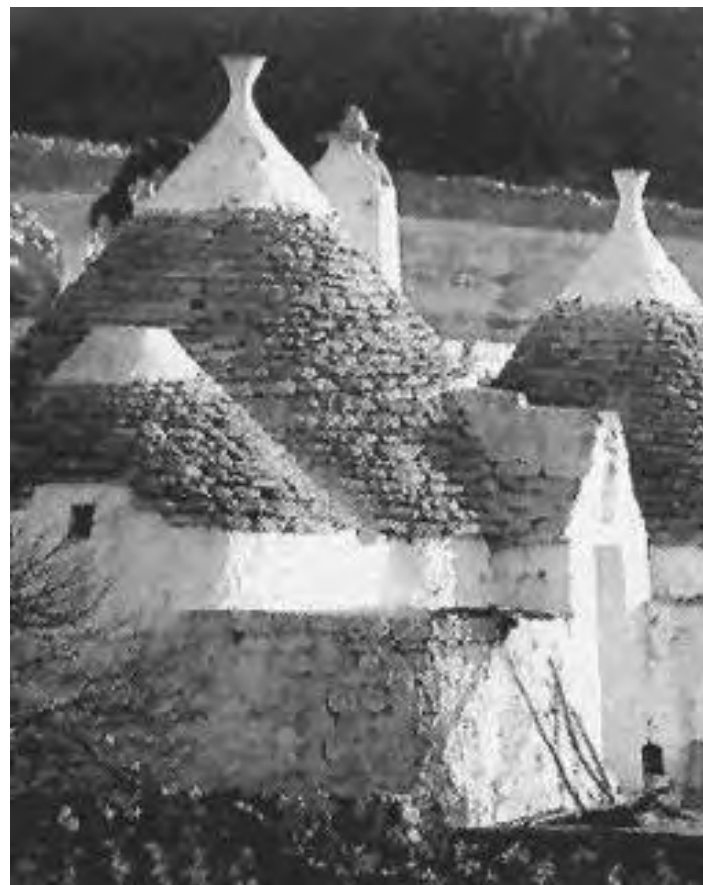
I trulli rappresentano una delle attrazioni più caratteristiche della Puglia

UNA TERRA TRA DUE MARI DOVE NON MANCA NULLA