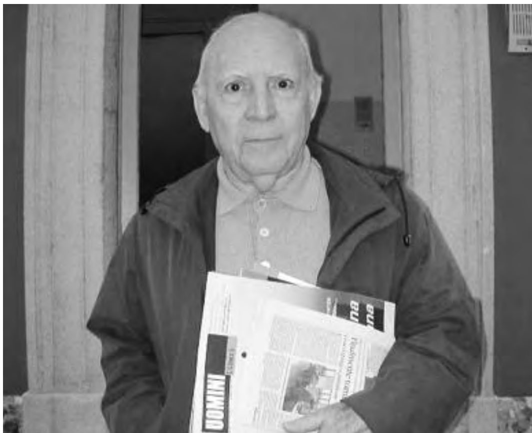
Lo scrittore e giornalista Vincenzo Consolo è nato a Sant'Agata di Militello, in provincia di Messina, 74 anni fa

«Cosa penso dei detenuti? I ricchi delinquono spesso per avere di più, i poveri, quasi sempre, soltanto per un pezzo di pane»