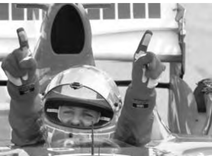
Momenti e personaggi di un 2006 straordinario per lo sport italiano: in alto gli azzurri del calcio in festa dopo la conquista del titolo mondiale, sopra Michael Schumacher sulla sua Ferrari, a destra Valentino Rossi

strato a tutti gli sportivi del mondo di meritare la fama che hanno e di giocare nel campionato più difficile del mondo e più bello in assoluto. Alla fine il presidente della Fifa Joseph Blatter ha fatto le scuse ai nostri campioni ed a tutti gli italiani, ammettendo che l'Italia ha meritato alla grande la Coppa del Mondo.