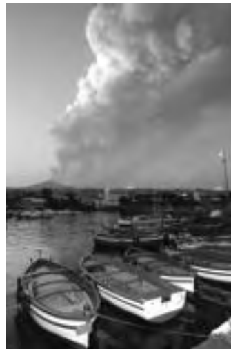
L'Etna fumante incombe sul mare

AMARCORD Nei sapori dell'isola la nostalgia delle origini