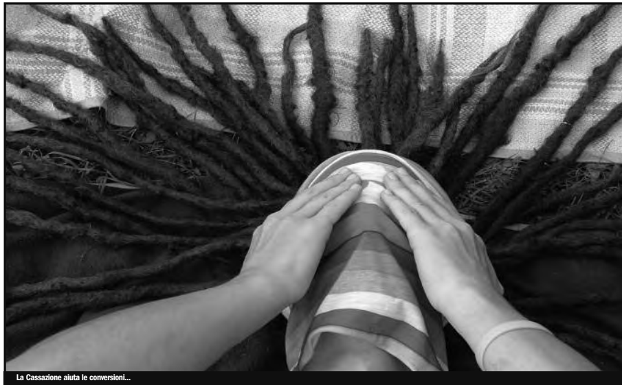
La Cassazione aiuta le conversioni...

Un nuovo inverno ci attende, sperando che dal territorio e dal contesto internazionale possano venire prassi e sperimentazioni che incrinino la gabbia d'acciaio in cui ci vogliono rinchiusi i guerrieri della droga.